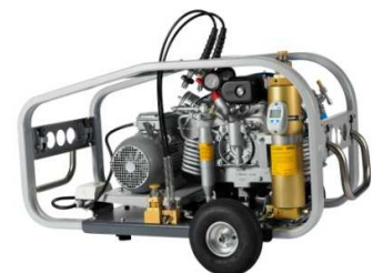
MARINER-E mit Fahrsatz

Er dient zum einfachen und kraftsparenden Transport mobiler Kompressoranlagen. Mit Lufträdern ausgestattet, ermöglicht er größtmögliche Mobilität. Komplett mit 1 Achse, 2 Rädern und Deichsel am Kompressorrahmen montiert.