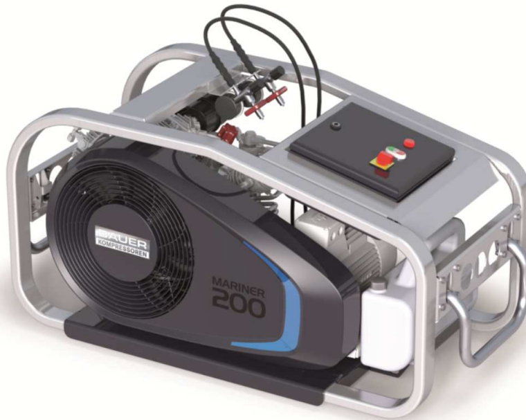
MARINER200-E mit optionaler Ausstattung