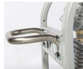
Sturzrahmen inkl. Tragegriffe

Der korrosionsbeständige Sturzrahmen bietet zusätzlichen Schutz für die Anlage und erlaubt zusätzliche Anbauten, z. B. einer Kompressorsteuerung oder eines größeren Filtersystems. Die Tragegriffe ermöglichen einfachen und komfortablen Transport.