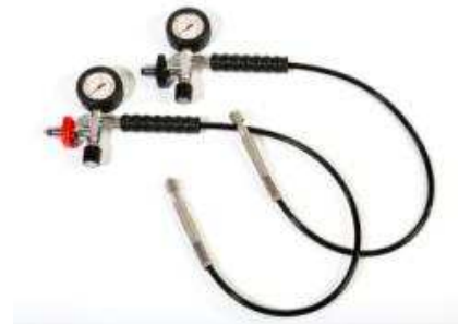
Fülleinrichtung PN200 bzw. PN300